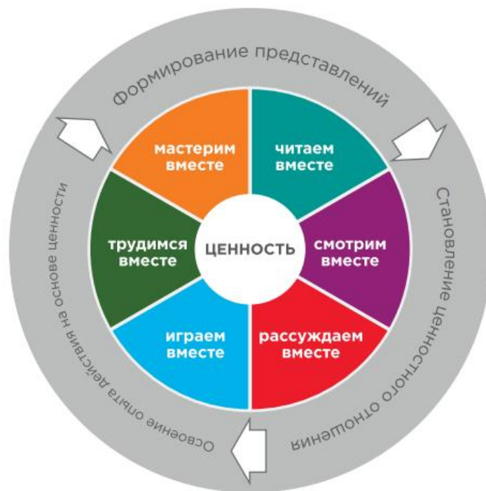
Рисунок 1. Педагогическая модель формирования ценностных ориентаций у детей дошкольного возраста.